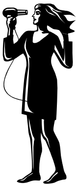
10. (Usted) se seca el pelo

Observa: en los ejemplos 4 , 5 y 10 los pronombres reflexivos asumen la función del posesivo correspondiente en inglés: