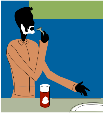
4. (Él) se afeita la barba